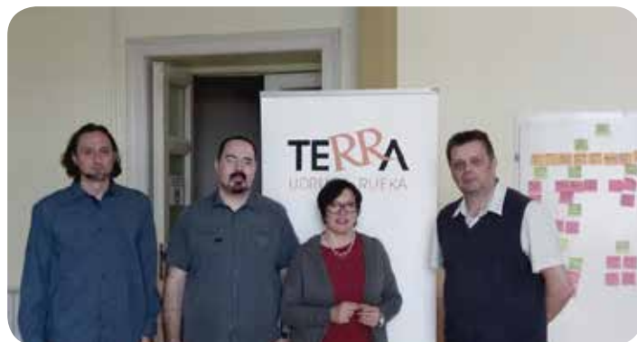
Επίσκεψη στην Κροατία