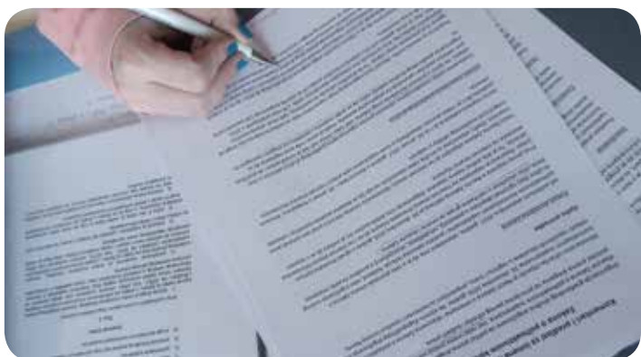
Τροποποιήσεις του νόμου για τις ψυχοδραστικές ελεγχόμενες ουσίες