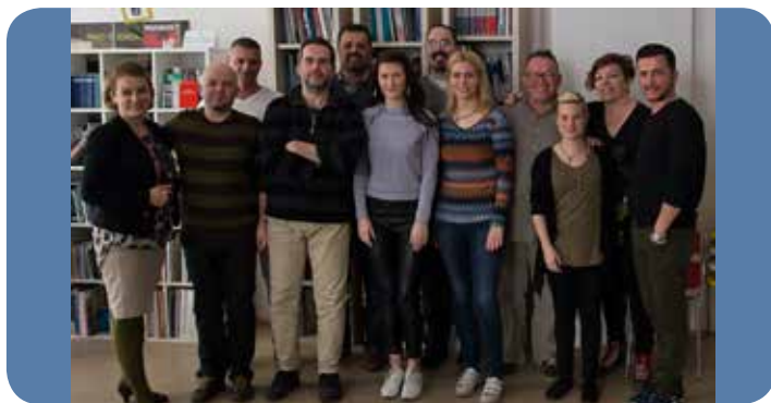
Η πρώτη συνάντηση του Δ.Σ. του DPNSEE για το 2017