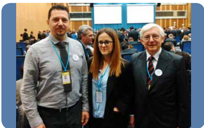
Η σημασία της 60ης Συνόδου της Επιτροπής Ναρκωτικών του ΟΗΕ (CND) για την Ελληνική πολιτική και πρακτική για τα ναρκωτικά.