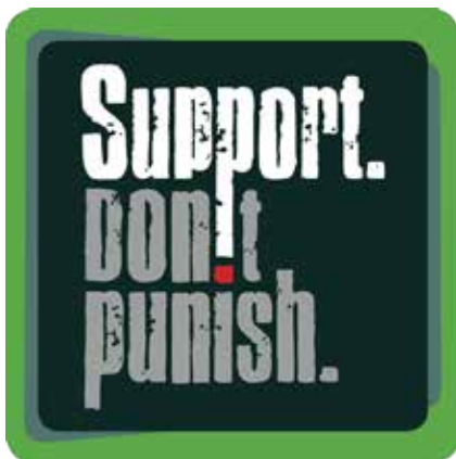
Δράσεις ανά χώρα: εκστρατεία «Υποστήριξε. Μην Τιμωρείς.»