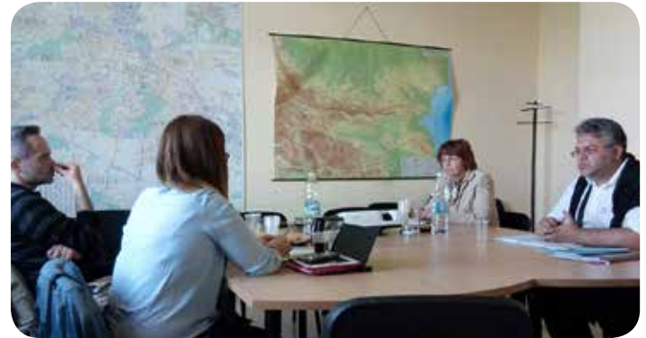
Επίσκεψη στην Βουλγαρία.