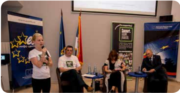
Εκστρατεία «Υποστήριξε. Μην Τιμωρείς.» στην έδρα του DPNSEE.