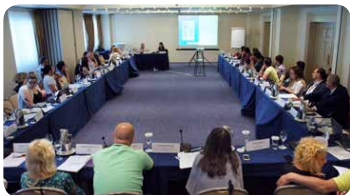
7ος Περιφερειακός Διάλογος στη Θεσσαλονίκη.