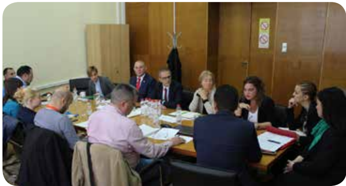
Νομοθεσία για τα Ναρκωτικά στη Σερβία.