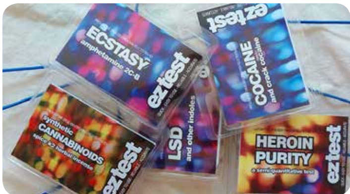
Το πρόβλημα των ναρκωτικών και η επίδρασή του στα παιδιά και τους νέους.