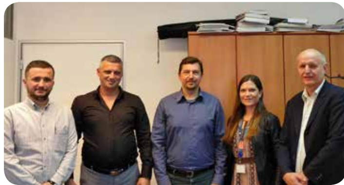
Επίσκεψη εργασίας στην Σλοβενία.