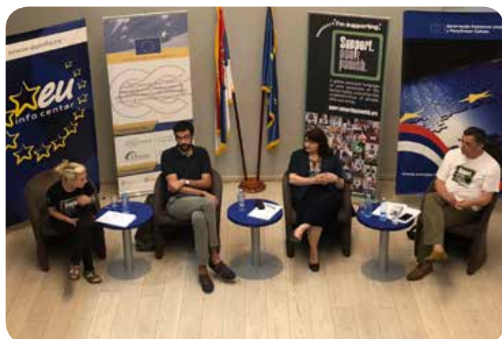
Η εκστρατεία «Υποστήριξε. Μην Τιμωρείς» στην ΝΑ Ευρώπη

- Το νέο Φόρουμ της κοινωνίας των πολιτών για τα ναρκωτικά (CSFD) της ΕΕ - Ο «Διογένης» στην Ειδική Υποεπιτροπή της Βουλής - Επιστολή στον Υπουργό Υγείας - Σειρά ανοικτών εθνικών διαλόγων από τον «Διογένη»