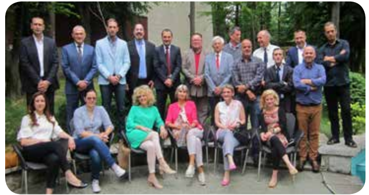
Συνεργασία για την πολιτική των ναρκωτικών μεταξύ των οργανώσεων της κοινωνίας των πολιτών και των εθνικών αρχών στη Νοτιοανατολική Ευρώπη