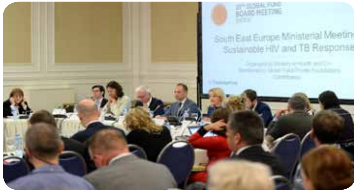
Διυπουργική Συνάντηση στην ΝΑ Ευρώπη για το HIV