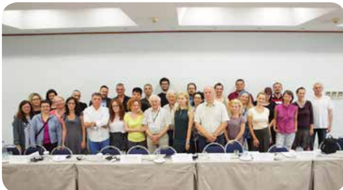
Περιφερειακό Συνέδριο στην Θεσσαλονίκη, 8 & 9 Ιουνίου 2018