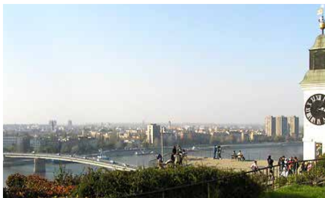
Συνάντηση του Δικτύου Συνεργασίας για την Πολιτική των Ναρκωτικών στην ΝΑ Ευρώπη στο Novi Sad