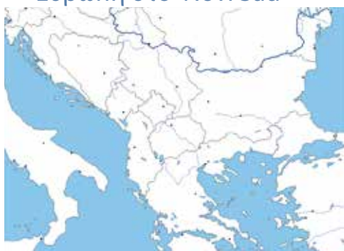
Νεά από τους συνεργάτες μας στην ΝΑ Ευρώπη