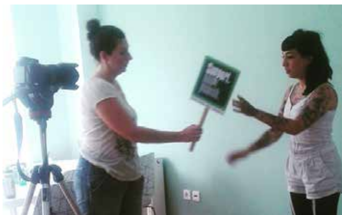
26 Ιουνίου, Παγκόσμια Ημέρα κατά των Ναρκωτικών και της Παράνομης Διακίνησης τους