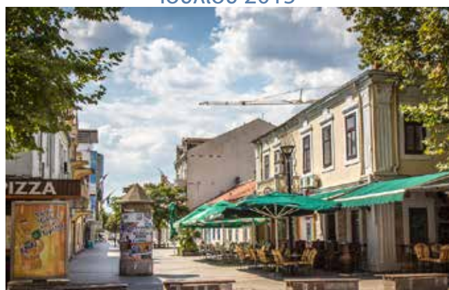
Μαυροβούνιο: το Παγκόσμιο Ταμείο αποσύρει τη χρηματοδότηση, κλείνουν οι υπηρεσίες μείωσης της βλάβης