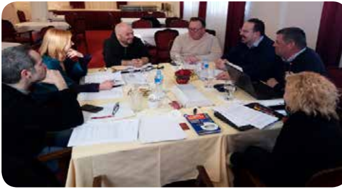
Συνάντηση Διοικητικού Συμβουλίου DPNSEE