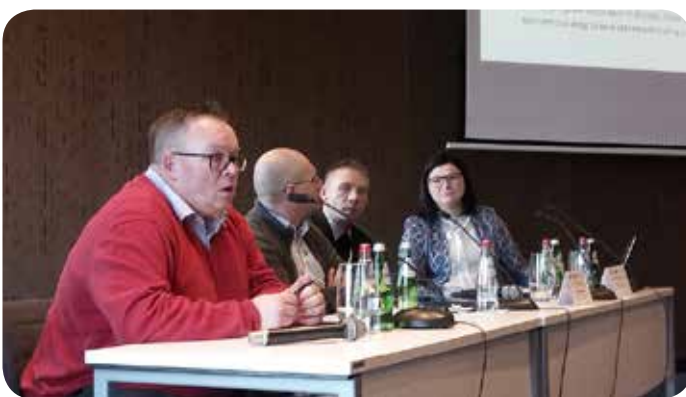
Διάλογος μεταξύ της ΚτΠ και δωρητών στο Βελιγράδι, με την υποστήριξη του OSF

- Ημερίδα: Αντιμετώπιση ανισοτήτων στην Υγεία: Ηπατίτιδα C και χρήση ενδοφλέβιων ναρκωτικών στην Βόρεια Ελλάδα